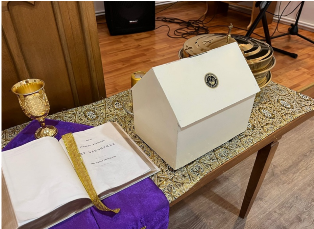
Caixa de oferta de alabastro

A igreja também coleta três grandes ofertas ao longo do ano. Em março e agosto, a oferta é para o Fundo de Evangelismo Mundial. Em outubro, a oferta destina-se a apoiar a educação fornecida pelo European Nazarene College na Armênia.